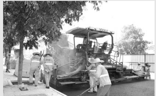
高温环境下沥青的粘合力比较好,炎天盛夏正是公路工程施工的黄金季节。8月14日,在湖州市经济技术开发区得业路,市政公司的沥青工正在烈日下“趁热打铁”进行沥青摊铺。沥青摊铺机、装载机来回穿梭,几名筑路工用铁锹将摊铺下来的沥青压得更平整。超过50℃的路面,夹杂着160℃沥青混合料,滚滚热浪扑面而来。他们头顶烈日汗如珠,脚踏热浪衣衫透。平整的道路在“高温侠”脚下不断延伸。