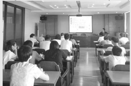
8月9日下午,集团公司四楼多媒体会议室举行OA软件财务模块培训。集团公司分管领导、财务公司人员、各分公司经理及试点项目经理、结算审核部和工程部负责人参加了培训。