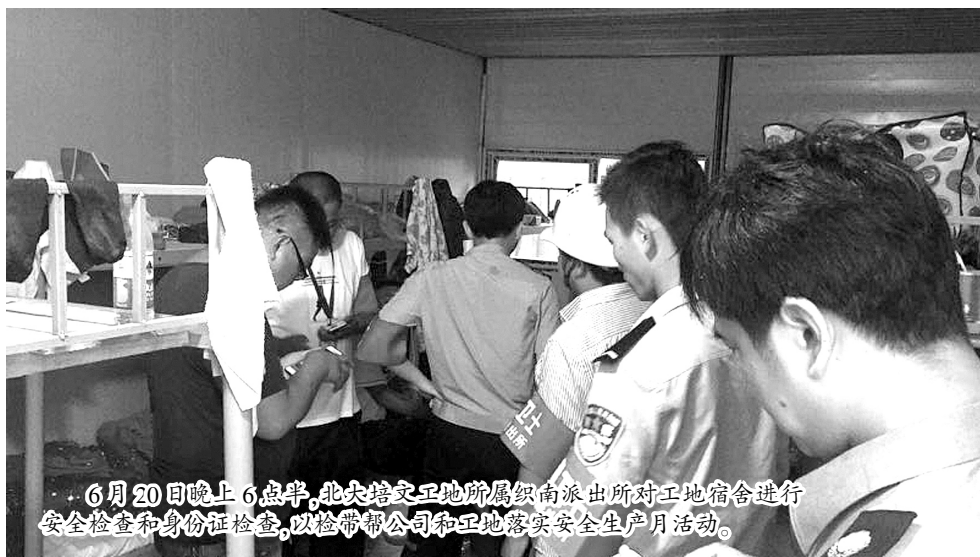
6月20日晚上6点半,北大培文工地所属织南派出所对工地宿舍进行安全检查和身份证检查,以检带帮公司和工地落实安全生产月活动。