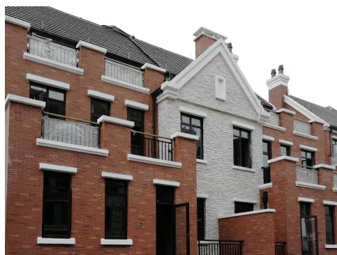
天河理想城IV标段临近竣工