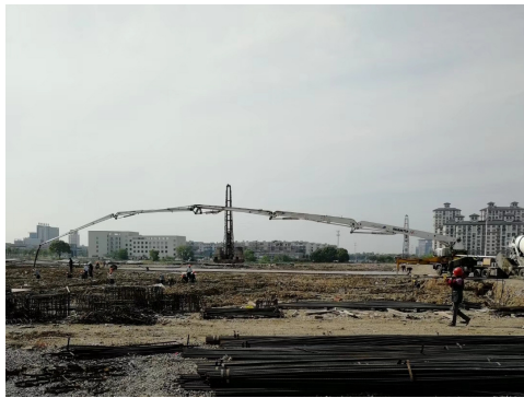
北大培文学校中学部在浇筑垫层